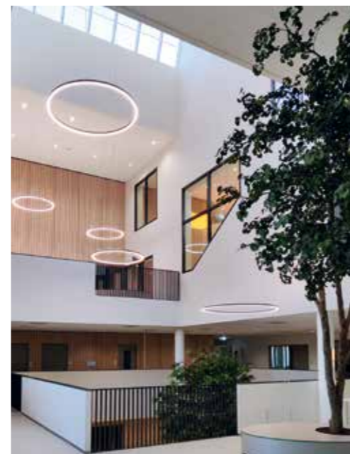
Spinoza20First Daltonlyceum met sporthal en jongerencentrum in Amsterdam.

Voor de realisatie van de AICS South East in het Zandkasteel, het voormalige hoofdkantoor van de ING aan het Bijlmerplein is de gemeente Amsterdam de samenwerking aangegaan met Bremen Bouwadviseurs voor de herinrichting van de monumentale daktuin. Daarnaast werd in het Bajeskwartier, op de plek van de parkeergarage van de voormalige Bijlmer Bajes, de nieuwbouw van het Spinoza20First Daltonlyceum met sporthal en jongerencentrum gerealiseerd. Een toekomstgericht gebouw met ruimte om te bewegen en ruimte voor de groeiende onderwijsvisie van de school.